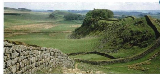
Le mur d'Hadrien, fortification construite par les Romains au niveau de la frontière Angleterre - Ecosse actuelle

Au III e siècle, des tribus viennent piller les richesses de la Gaule avant de repartir. D'autres viennent s'installer et participent à la défense des frontières .