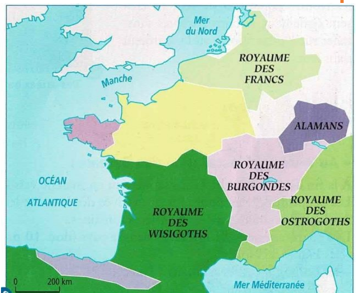
7 La Gaule aux V e -VI e siècles après J.-C.